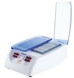
Across System® Card Incubator