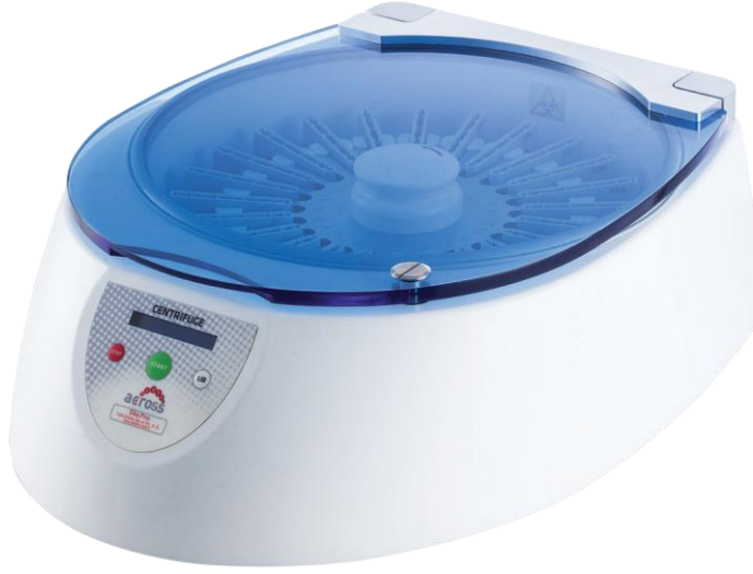
Across System® Card Centrifuge